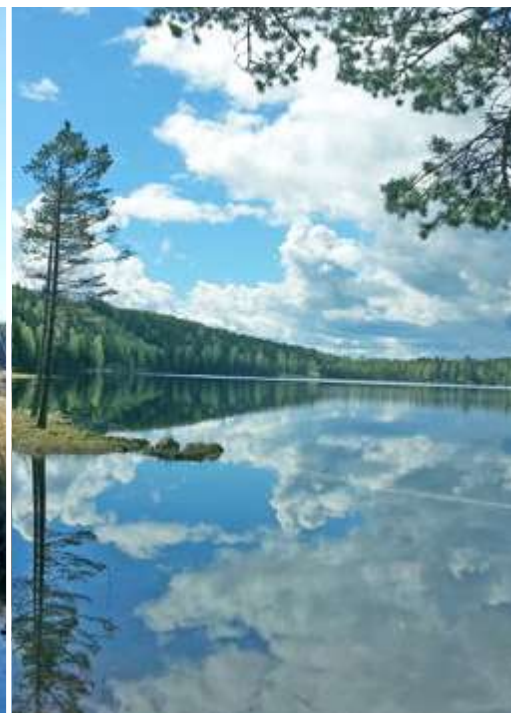
Vannet Tennungen, Nord-Odal, som får støyen fra hele Songkjølen-anlegget rett i fra øst.