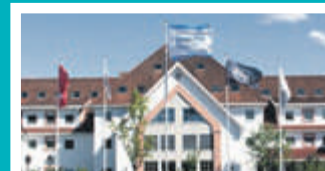
Olavsgaard Kontorsenter – Skedsmo Hvamstubben 17 – 2013 Skjetten

Du skal vite at vi er der og du skal vite hvor vi er