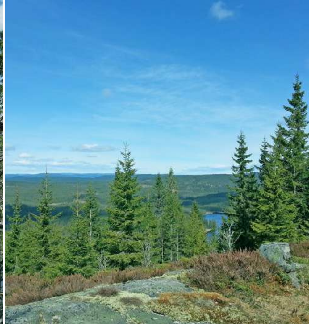
Utsikt nordvestover fra Knappen ved Murukollen, på grensen mellom Nord-Odal og Nes kommune: Her skal en av turbinene settes opp, den vestligste ved Songkjølen industriområde.