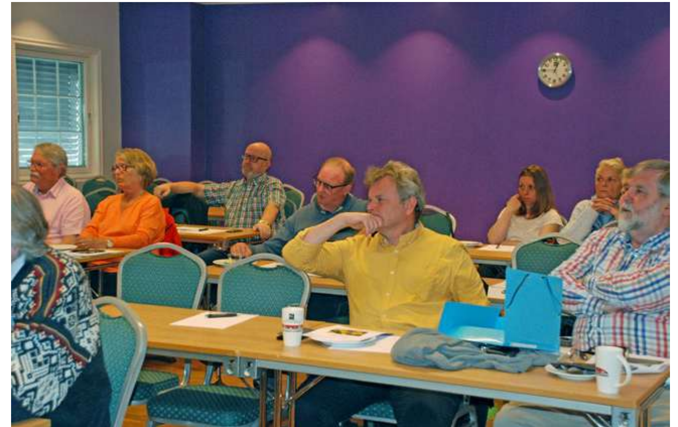
Utsnitt av forsamlingen

takk sender Norges Hytteforbund til de avtroppende styremedlemmene som etter år i tjeneste for hyttefolket i Norge nå har levert stafettspinnen videre.