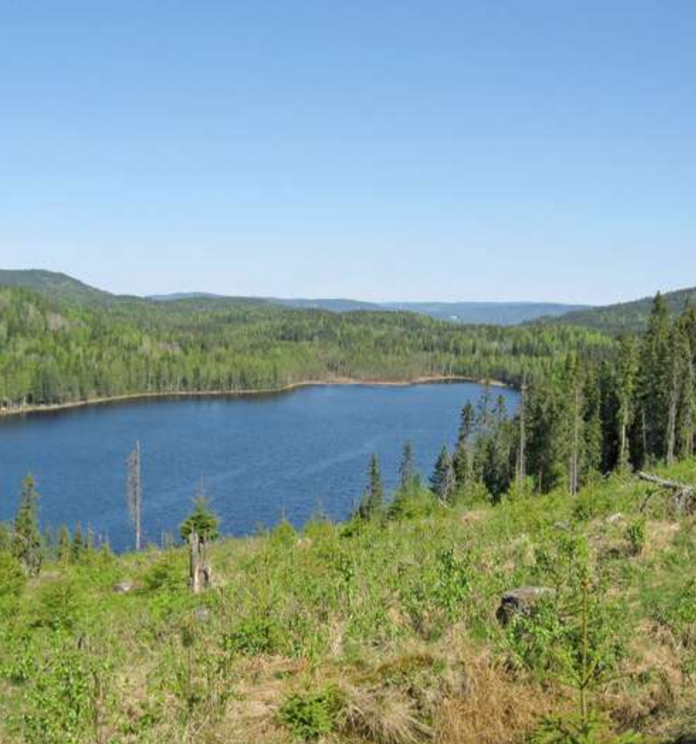
Utsikt fra vindkraftområdet nordøstover mot vannet Tennungen, Nord-Odal.