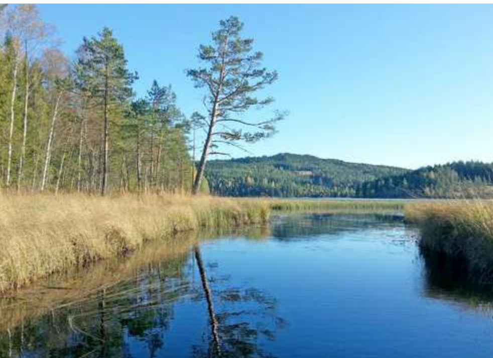
Fra vannet Murua mot Knappen/Murukollen i sør. Turbinen plasseres på toppen.