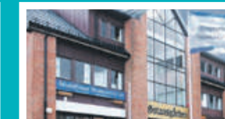
Jessheim – Ullensaker Gotaasgarden, Gotaasalleen 9