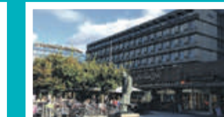
Solli Plass – Oslo Henrik Ibsens gate 90, 3. etg.

Advokatfirmaet Nicolaisen ble etablert i 1988. Vi er et av Akershus største advokatfirma, og vi har også kontor på Solli plass i Oslo. Fra våre kontorer yter vi privat- og forretningsjuridisk bistand til klienter fra Oslo, Romerike, Lillestrøm, Asker og Bærum.