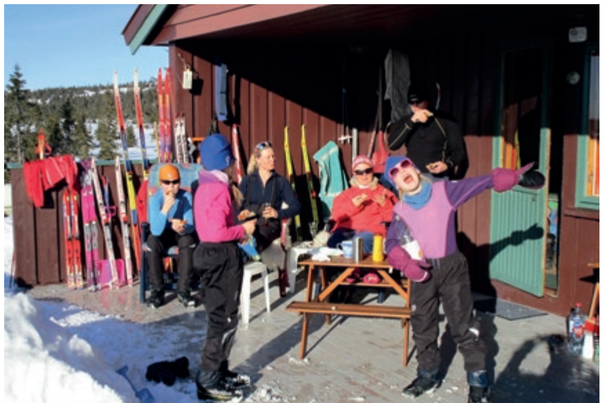
Artikkelforfatter har her fylt hytteterrassen med barn og barnebarn – slik det pleier å være en vinterferie.

Ringsaker kommune har funnet ut at hytteeiere kan de behandle som de vil, vi har jo ikke stemmerett, så bunnfradraget har sunket og skattetaksten økes jevnt og sikkert. 2016-bunnfradrag 110.000 kroner og skatte-